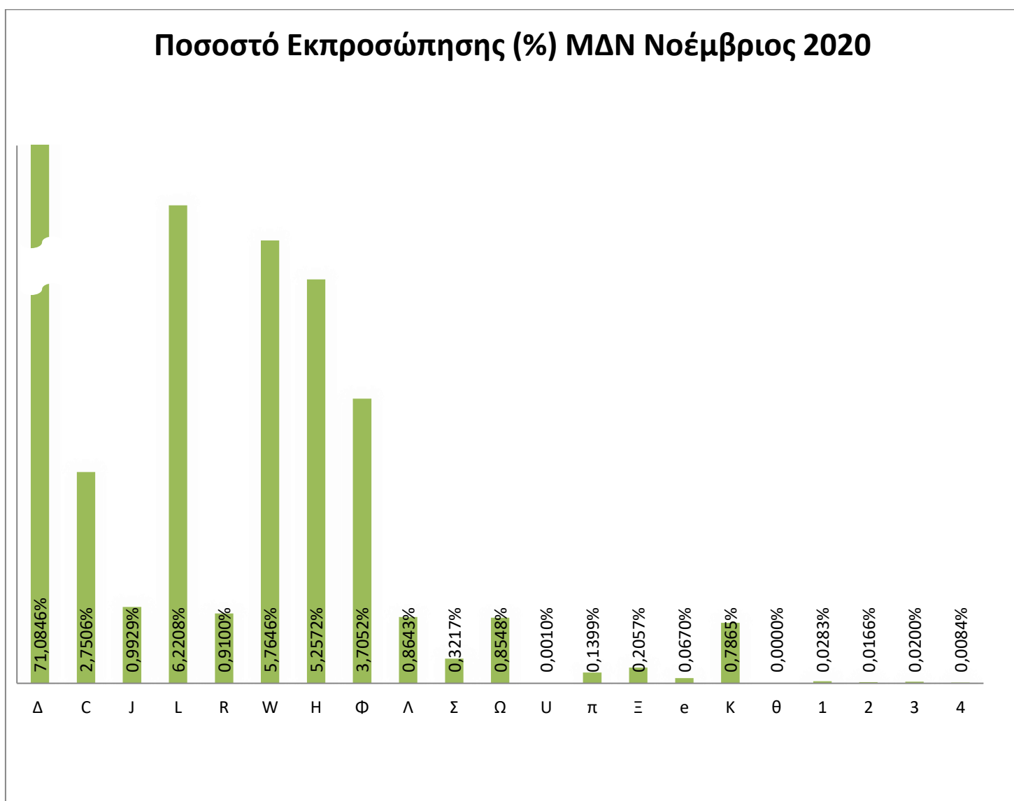
Γράφημα 1: Ποσοστό (%) στο σύνολο της Μηνιαίας Προμήθειας στα ΜΔΝ ανά Συμμετέχοντα για τον μήνα Νοέμβριο 2020.