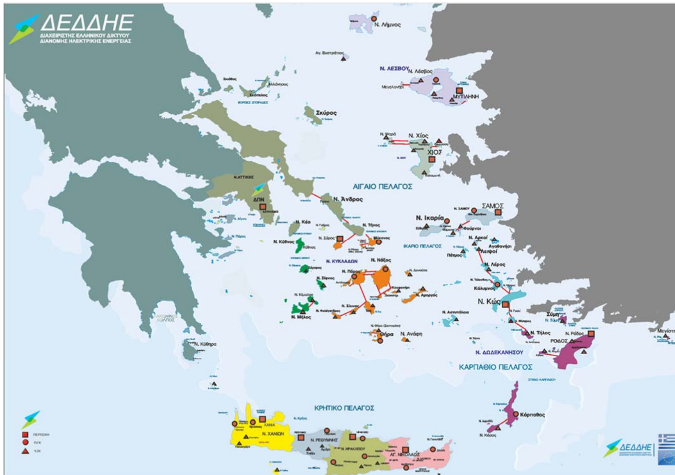
Σχήμα 2: Γεωγραφική αποτύπωση υποβρυχίων καλωδίων ΜΤ στα νησιά του Αιγαίου